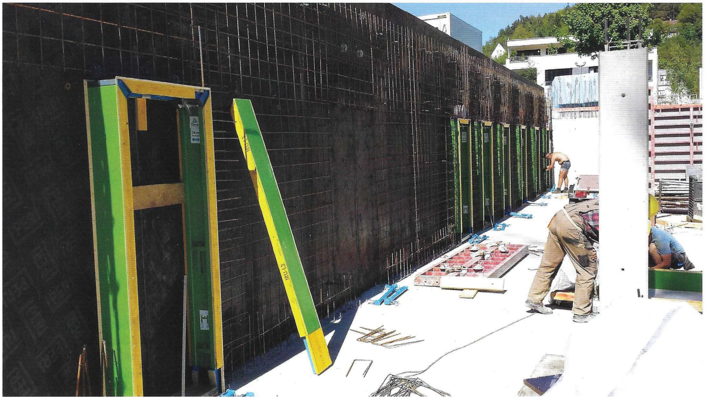
Besonders bei wiederkehrenden gleichen Aussparungen, wie z.B. bei Lochfassaden an Mehrfamilienhäusern oder Bürobauten lässt sich mit Timron-Schalungen die Bauzeit deutlich reduzieren.