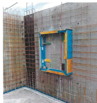
Die Fensterschalung wird mit teleskopierbaren Multielementen, mit einstellbaren Varioelementen oder einer Kombination aus beiden zusammengesetzt.

Türen, Fenster und Wand- oder Deckendurchführungen extrem schnell schalen. In weniger als 5 Minuten sind die wiederverwendbaren, pulverbeschichteten Aluminiemelemente eingeschalt. Der Systemeckkeil in Verbindung mit dem Schal Schloss ermöglicht ein noch schnelleres Ausschalen, denn durch das Entfernen des Eckkeils entsteht genügend Freiraum zur Demontage der Schalelemente. Ohne Kranhub lassen sich die leichten Aluminiumteile