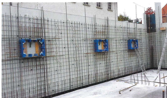
Keine fünf Minuten pro Fenster braucht man für das Schalen mit dem Aussparungssystem von Timron.

Mit der neuen Produktionslinie der Mini-Varios deckt der Hersteller nun auch den Bereich der kleinen Aussparungen für Wand- und Deckendurchbrüche ab. Sie funktionieren nach demselben Prinzip, sind ebenso schnell ein- und ausgeschalt und sind mit allen anderen Timron-Elementen kompatibel. ■